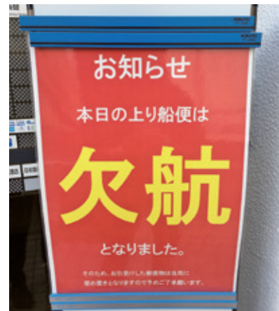
▲恐怖の真っ赤なお知らせ「欠航となりました。」